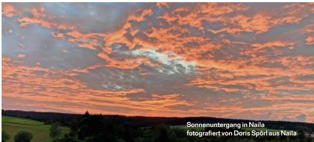
Sonnenuntergang in Naila