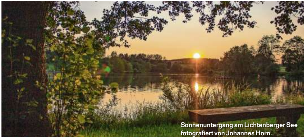
Sonnenuntergang am Lichtenberger See fotografiert von Johannes Horn.

Die WIR-Redaktion bedankt sich für die vielen beeindruckenden Bilder, die Sie uns an die E-Mail-Adresse redfrankenwald@kurier.de schicken. Auf dieser Seite präsentieren wir einige der Bilder, die es bislang noch nicht ins Blatt geschafft haben.