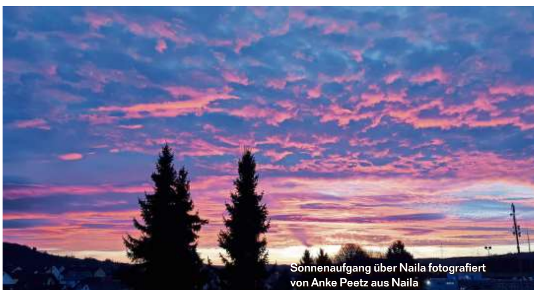
Sonnenaufgang über Naila fotografiert von Anke Peetz aus Naila