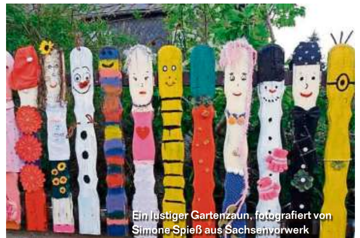
Ein lustiger Gartenzaun, fotografiert von Simone Spieß aus Sachsenvorwerk