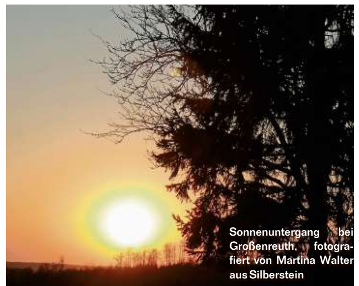
Sonnenuntergang bei Großenreuth