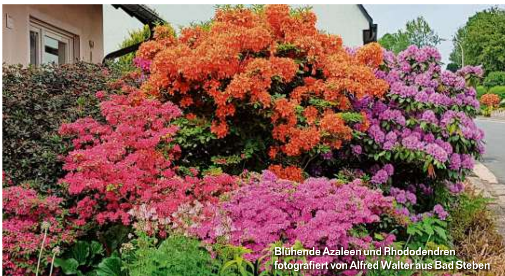
Blühende Azaleen und Rhododendren