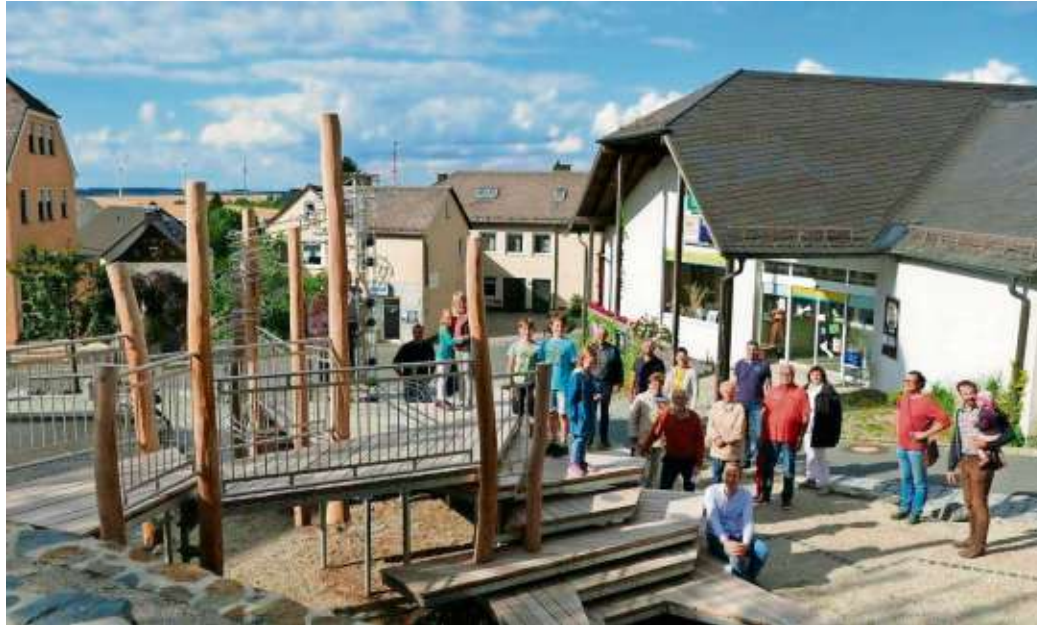
Ein begehbare Objekt, eine Darstellung des Gemeindegebietes mit seinen Höhenschichten mit integrierter Kugelbahn, wertet die Berger Ortsmitte auf und lädt ein zum Verweilen.