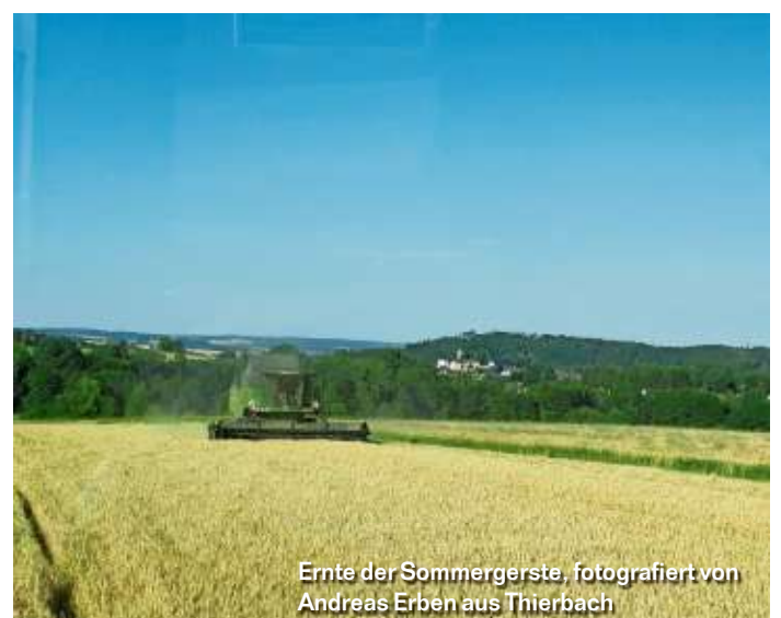
Ernte der Sommergerste, fotografiert von Andreas Erben aus Thierbach