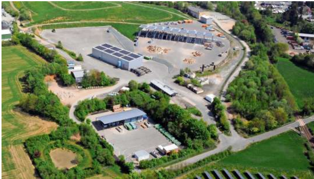
Ein Luftbild Deponie AbfallServiceZentrum aus dem Jahr 2018.

So entstanden 1992 bis 1994 acht Wertstoffhöfe. Das Wertstoffmobil tourte 1992 erstmals durch die Gemeinden des Landkreises Hof. Neben der mobilen Problemabfallsammlung entstand 1992 eine stationäre Sammelstelle am Wertstoffhof Hof. In Kooperation mit örtlichen Landwirten wurden ebenfalls 1992 neun Kompostanlagen zur Kompostierung von Grüngut und zum Teil Bioabfälle gebaut. 1995 war die Biotonne flächendeckend eingeführt. Der AZV