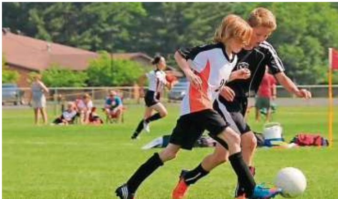
Sechs Vereine schließen sich zusammen.