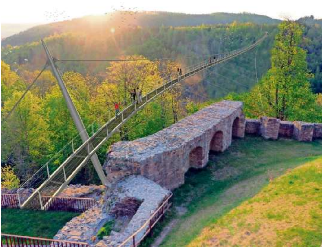
Die längste Hängebrücke der Welt entsteht im Frankenwald. Sowohl die Lohbachtal- als auch die Höllentalbrücke verlaufen leicht S-förmig. Hier eine Visualisierung der Lohbachtalbrücke.