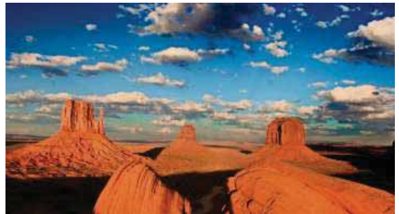
Sonnenuntergang im Monument Valley/Utah.

Der Filmemacher gewährt dabei erstmals einen Blick hinter die Kulissen des Reisens mit der Kamera, zeigt sozusagen das „Making of“ im Film selbst. So wer-