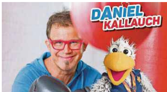
Vorverkaufsstellen sind und die Tourist-Information Bad Schreibwaren Ernst Nachfolger, Steben in der Wandelhalle im Hauptstraße 18 in Bad Steben Kurpark.