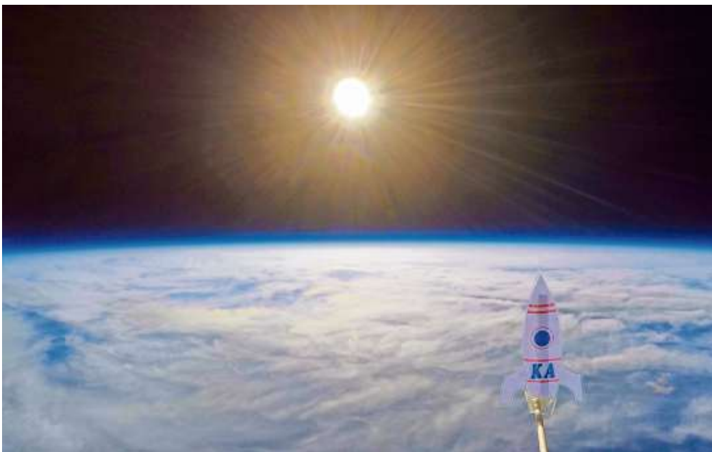
Die Kameras lieferten faszinierende Bilder aus 38.200 Metern Höhe.