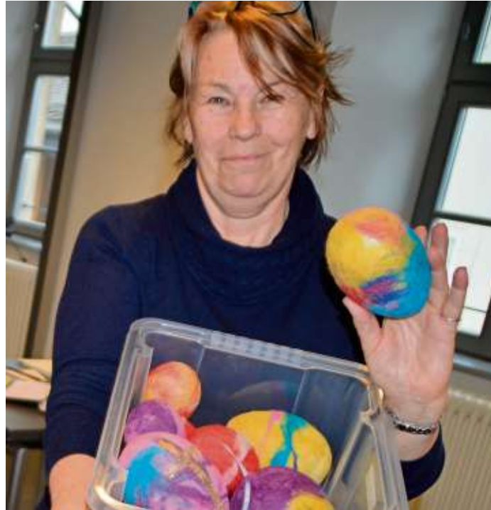
Ostereier färben war gestern - der neue Trend geht zum Filzen.

Wer nicht Jahr für Jahr Ostereier färben, sondern mal was Neues ausprobieren möchte, ist in diesem Kurs genau richtig. Denn Ostereier kann man auch filzen. Die ovalen Styroporeier bekommen so ein kuscheliges Outfit und sind ein besonderer Blickfang in Vasen, an Ästen oder als Tischdeko. Lernen Sie in einem Grundkurs mit wenig Materialeinsatz und Zeitaufwand krea-