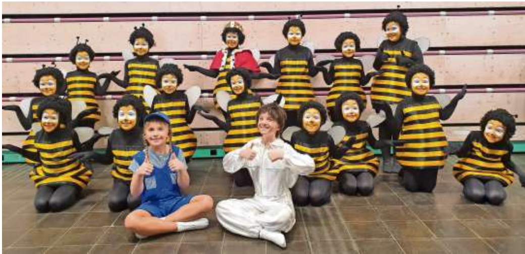
Auch die Bienen konnten in Bayreuth mit ihrem Schautanz punkten.

Auch beim Schautanz konnten die „fleißigen Bienen“ der Jugendgarde gut punkten und erreichten ebenso 402 Punkte. Gleich fünf Tanzmariechen – drei in der Altersklasse Jugend und zwei bei den Junioren – stellten sich ebenso den prüfenden Augen der Jury. Alle zeigten prima Leistungen und tanzten fehlerfrei durch.