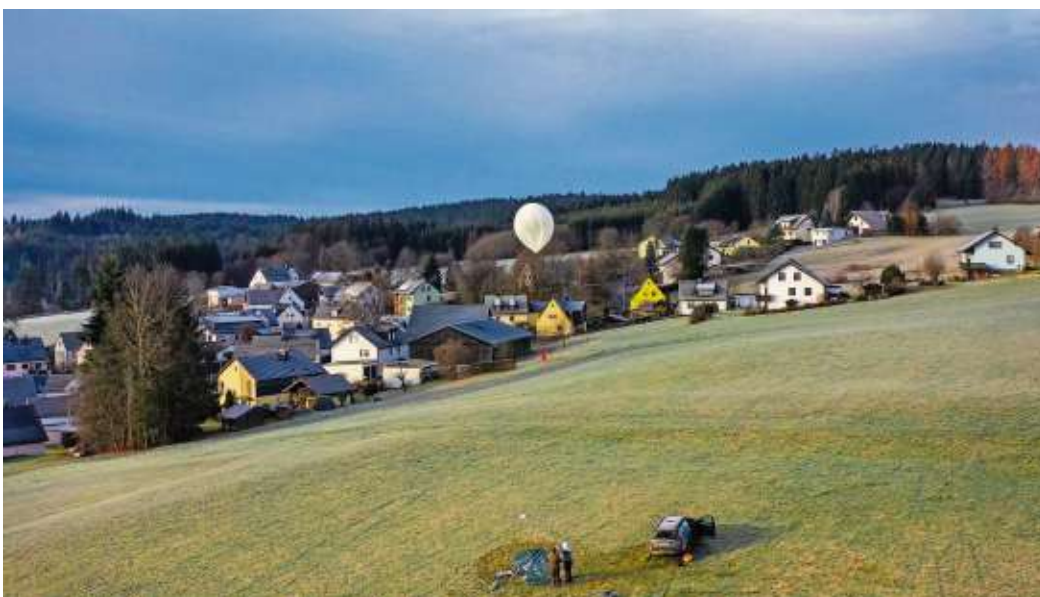
Am 1. Dezember 2019 startete die Stratosphärenmission von Lippertsgrün aus. Die Lippertsgrüner gingen davon aus, dass die Sonde in Prag landen würde. Es kam aber anders.