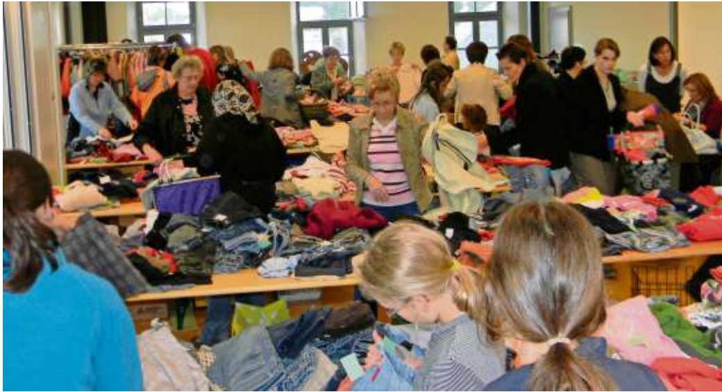
Am Samstag, 29. Februar, findet im Philipp-Wolfrum-Haus der Kinderkleiderbasar statt.

Angenommen wird modische, aktuelle Frühjahrs- und Sommermode (keine Wintersachen); maximal 40 Teile in den Größen 56-176 (gut erhalten, fleckenlos, gewaschen und gebügelt), maximal drei Paar neuwertige Schuhe, Spielsachen,