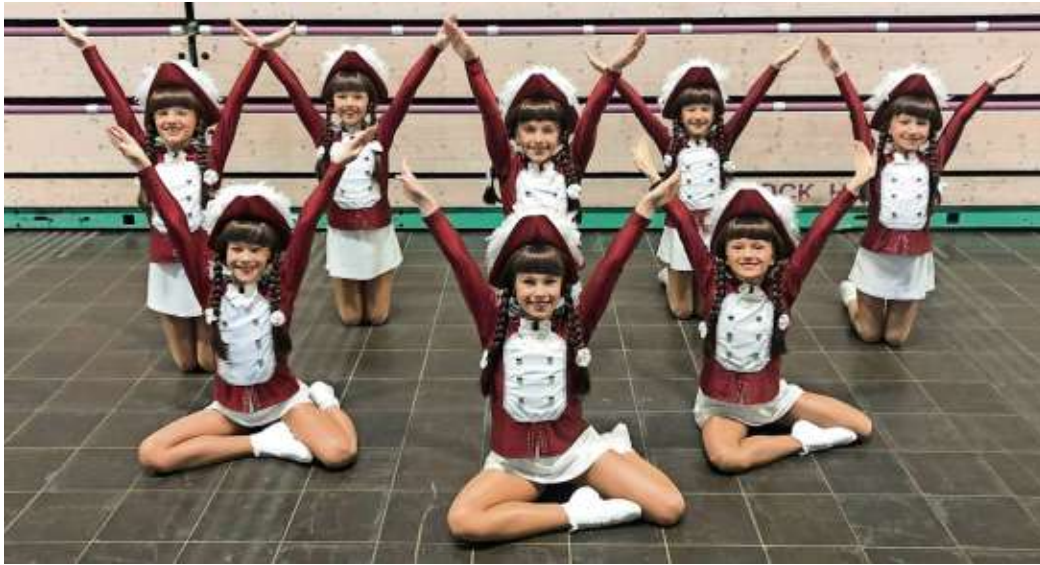
Die TuS-Jugendgarde wurde Vizemeister bei der Oberfränkischen Meisterschaft in Bayreuth.

Lippertsgrün/Bayreuth - Stolz standen die acht Mädels der Lippertsgrüner Jugendgarde bei der Siegerehrung am Podest, als am vergangenen Samstag in Bayreuth bei der Oberfränkischen Meisterschaft im karnevalistischen Tanzsport die Erstplatzierten aufgerufen wurde. Mit der bisher besten Saisonleistung von 402 Punkten ertanzten sie sich den 2. Platz hinter der Garde des Coburger Mohr und wurden somit Oberfränkischer Vizemeister. Die Whats-App Gruppen des Vereins, der Vorstandschaft und Trainer standen nach diesem Erfolg kaum still, da jeder zu dem tollen Erfolg gratulieren wollte.