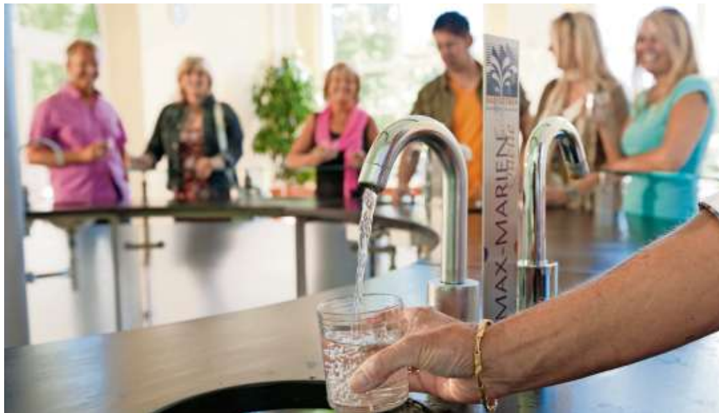
Gesundheitsurlaub wird immer beliebter - dieser Trend bescherte dem Kurort Bad Steben im vergangenen Jahr knapp 372.000 Übernachtungen.

Der erfolgreiche Trend scheint sich nach ersten Zahlen auch im neuen Jahr fortzusetzen. So besuchten alleine im Januar 2.678 Privatgäste das Staatsbad – ein stolzes Plus von 23 Prozent gegenüber dem Vorjahr. Die guten Zuwächse im Januar zeigen sich dabei über alle Beherbergungsarten hinweg. Lediglich