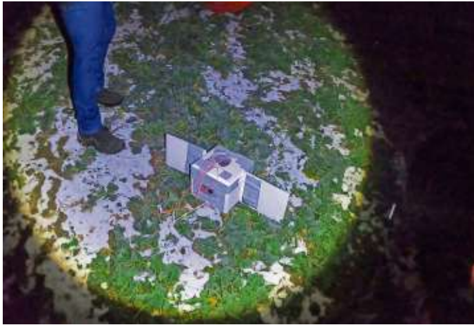
In Polen, in der Nähe von Kattowitz fanden die Stratosphärenflieger ihre Sonde wieder.