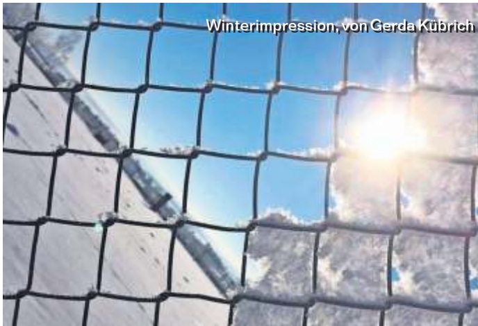
Winterimpression, von Gerda Kübrich