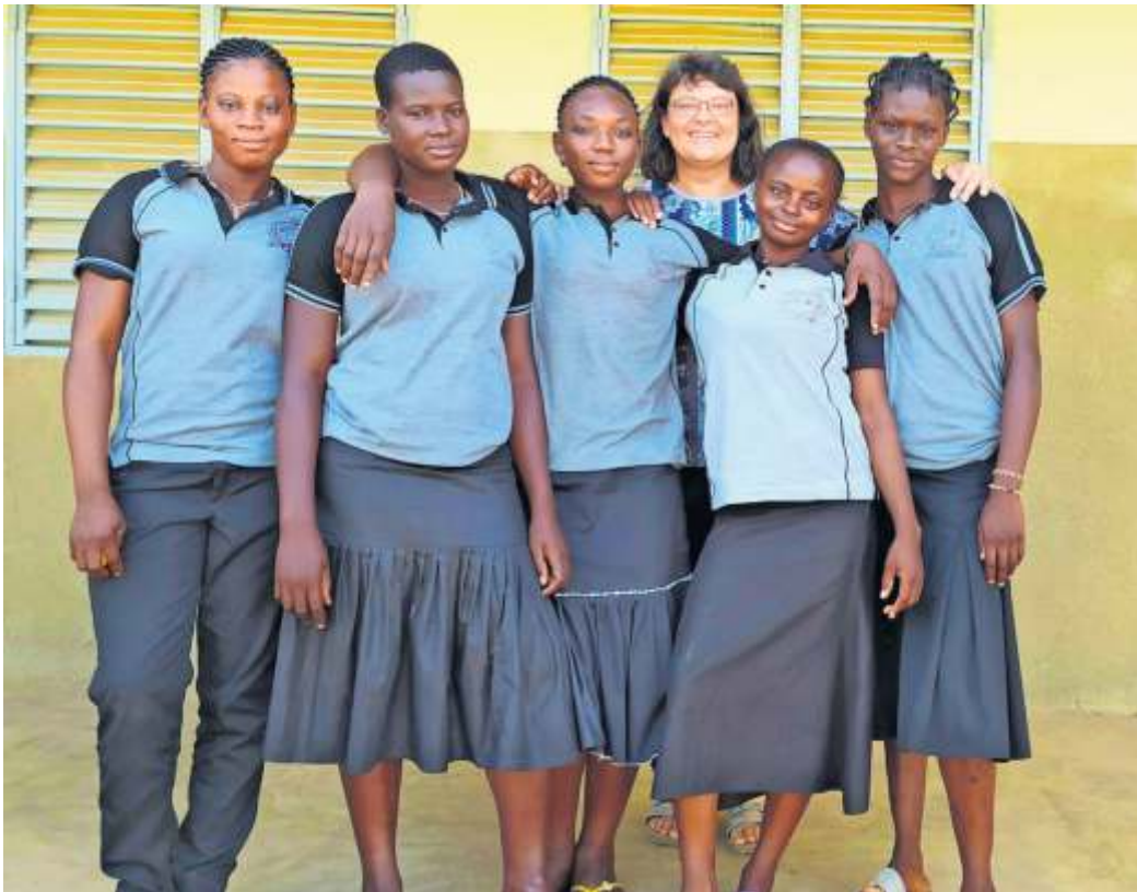
Schüler und Schülerinnen in Schuluniform.