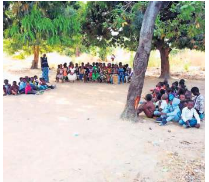
Kindergottesdienst unter Bäumen.

Hier werde ich nie den Status eines Einheimischen erreichen, da hindert mich schon meine Hautfarbe dran. „La blanche“, die Weiße, so werde ich hier bezeichnet, zumindest von den Leuten, die mich nicht kennen. Meine Freunde hier kennen meinen Namen, kennen meine Geschichte, teilen ihr Leben mit mir. Ich bin hier gut aufgenommen worden. Ich bin glücklich. Es gibt hier mehr als genug Arbeit für mich, vor allem in „meiner“ Schule. So bin ich hier in der „Fremde“, die mir jeden Tag mehr ein Stück Heimat wird.