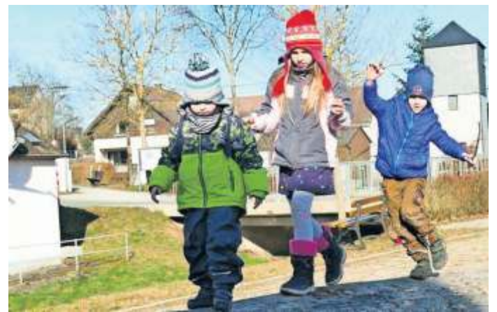
An dieser Station ist Balance gefragt

Highlight, auch die Kinder, die momentan die Einrichtung leider nicht besuchen können, gibt's nun eine Dorfrallye. Für die Teilnahme einfach einen Laufzettel