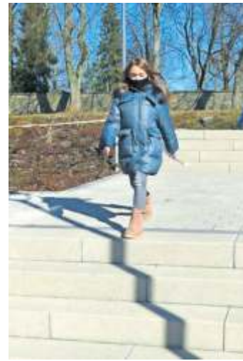
Wie viele Treppenstufen gibt es an der Grundschule?