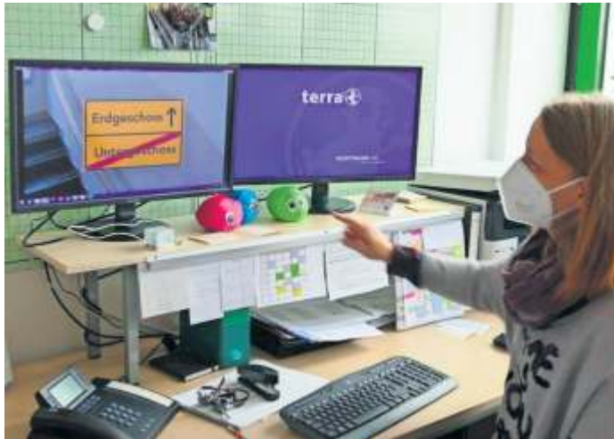
Das Foto zeigt die stellvertretende Schulleiterin der Muischen Realschule bei der Vorstellung des Films „Entdeckungstour durch die Schule“.