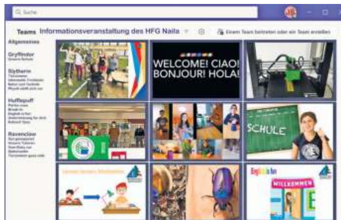
Virtueller Einblick ins vielfältige Lehrprogramm.