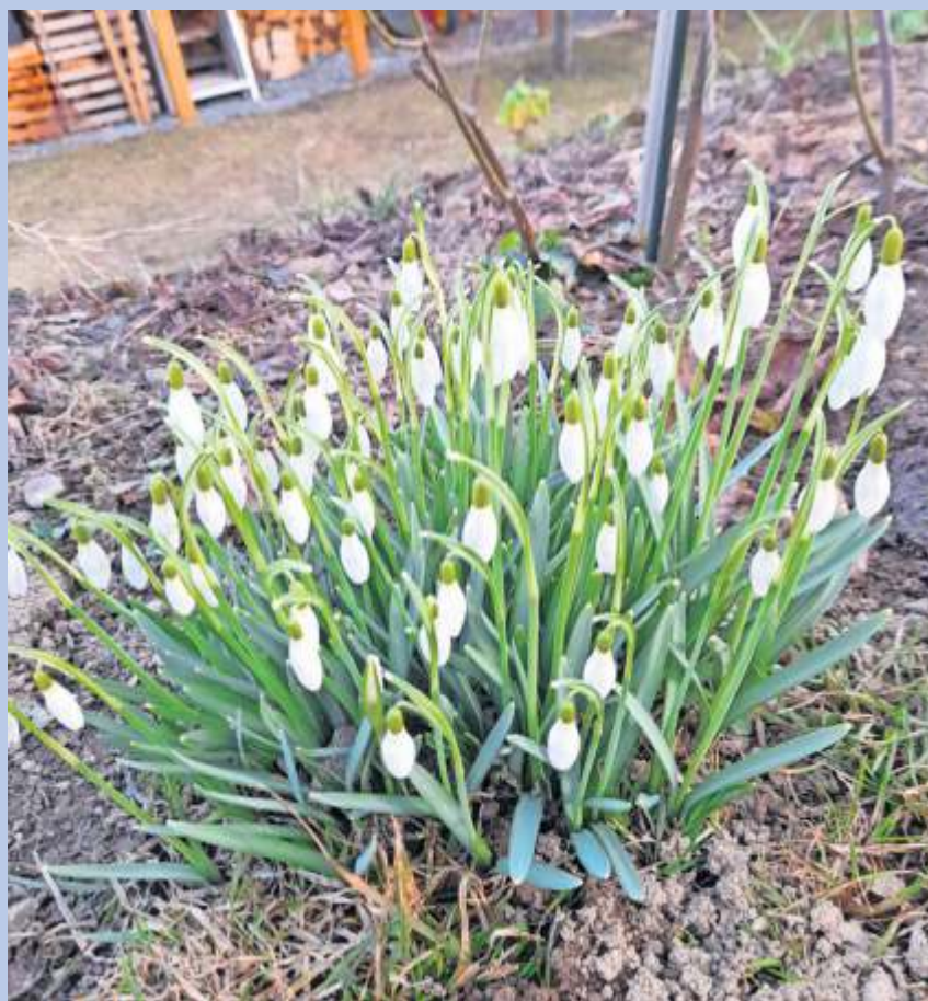
Erste Frühlingsboten im heimischen Garten