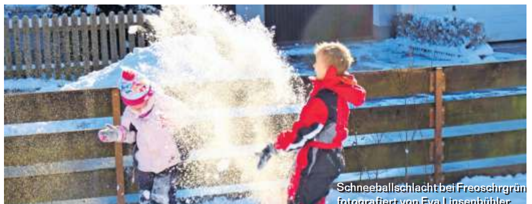
Schneeballschlacht bei Freoschrün