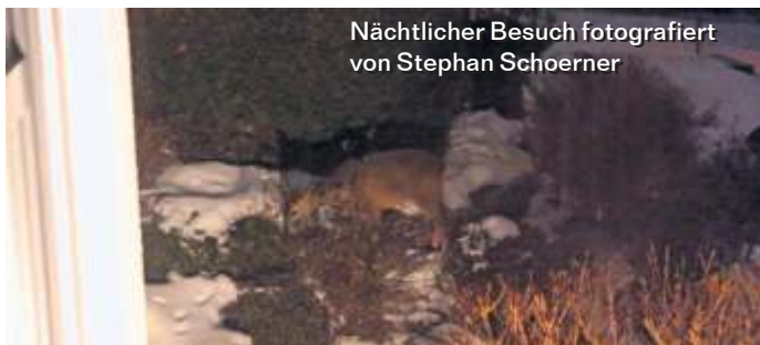
Nächtlicher Besuch