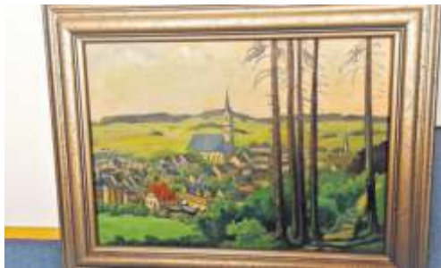
Naila in den 1920ern