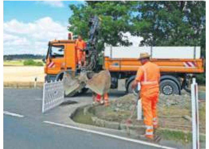
Im Zuge der Bauarbeiten werden auch Reparaturen am gesperrten Parkplatz durchgeführt.

wendig und wird gewährleistet, schon allein für den Winterdienst, aber auch für den landwirtschaftlichen Verkehr“, betont Grüner, der zudem von 50 Meter Radfahrstraße mit 1,85 Metern Breite am Ortsausgang von Berg als Überleitung zur Querungshilfe berichtet. „Auf der gegenüberliegenden Seite bleibt der bisherige Gehweg erhalten“, betont Bürgermeisterin Rubner und erinnert, dass seinerzeit der Berger CSU-Ortsverband das Thema Geh- und Radweg anpackte, unterstützt vom CSU-Landtagsabgeordneten Alexander König. „Letztlich scheiterte der erste Planungsentwurf an nur einem Grundstückseigentümer, während alle anderen bereitwillig das Projekt unterstützten“, berichtet Rubner und dankt dem staatlichen Bauamt Bayreuth für den zweiten Ent-