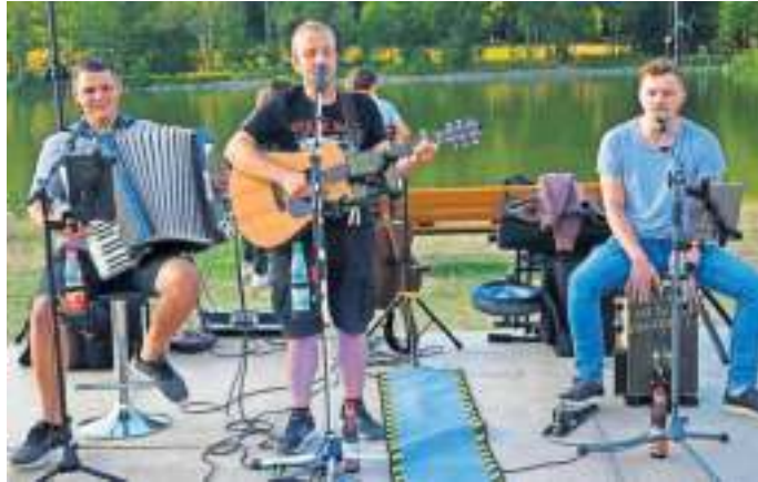
Livemusik am Samstag, 3. September bei der Feuerwehr Geroldsgrün mit dem Trio Akustika.

Geroldsgrün – Am ersten Septemberwochenende öffnet die Feuerwehr Geroldsgrün wieder ihre Türen und Tore für die Bevölkerung, um endlich wieder gemeinsam feiern zu können. Beginn ist am Samstag, 03. September, um 14.30 Uhr mit einer Schauübung an der Lothar-von-Faber-Grundschule . „Aufgrund der Trockenheit haben wir uns dazu entschlossen, die Lösübung „trocken“, also ohne Wasser durchzuführen“ so Matthias Denk, 1. Kommandant. Nach der Übung lädt die Wehr ins Gerätehaus zum Festbetrieb. Für das leibliche Wohl stehen Fassbier, Bratwurst und Steaks, Schaschlik, Pommes und vieles mehr bereit. Ab 19.00 Uhr spielen „Trio Akustika“ handgemachte Livemusik , deren Repertoire von Schlager, Party und Rock für jeden Musikfreund etwas beinhaltet. Gegen 20 Uhr öffnet die Bar und wartet mit klassischen Drinks und zudem mit einer kleinen Auswahl an Cocktails auf Besucher. Der Sonntag, 04. September , startet um 9.30 Uhr mit einem zünftigen Früh-schoppen . Hierzu bietet die