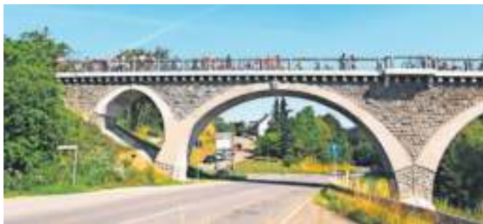
Die Bogenbrücke in Naila ist beim Tag des offenen Denkmals dabei.

Die Eisenbahnbrücke über das Selbitztal ist Bestandteil des Geh- und Radweges auf der ehemaligen Bahnlinie zwischen dem Bahnhof Naila und Schwarzenbach a. Wald und damit jederzeit frei zugänglich. Einstiegsmög-