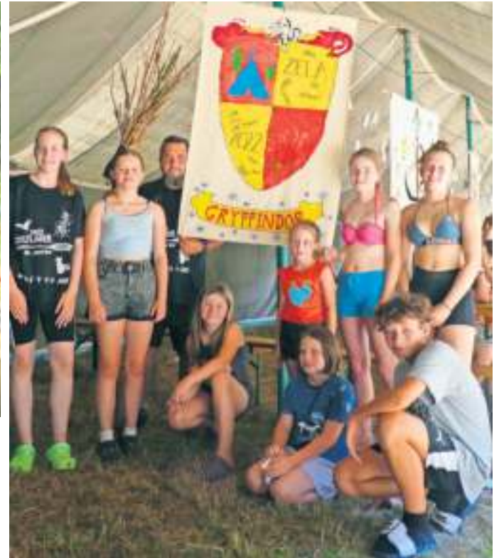
Mitglieder eines der vier ‚magischen‘ Häuser mit ihrem selbstgestalteten Banner.

Bei erneut strahlendem Sonnenschein und Temperaturen von über 30 Grad bot am Donnerstag das Schwimmbad in Steinwiesen die Gelegenheit zur Abkühlung und zum Beachvolleyball. Die Nacht wurde für einen ‚Überfall‘ auf das Zeltlager der Jugend Kronach genutzt. Der dortige Wimpel konnte zwar vom Mast gerissen, aber leider nicht aus dem Lager gebracht werden. Danach wurde noch einvernehmlich am dortigen Lagerfeuer gefachsimpelt; das eigene Feuer musste aufgrund der Waldbrandgefahr im Leitschtal ab der Wochenhälfte leider ausfallen. Ein spätes Frühstück lockte dann am Freitag auch die letzten Nachtwachen hervor. Vorbereitet wurde es - wie auch