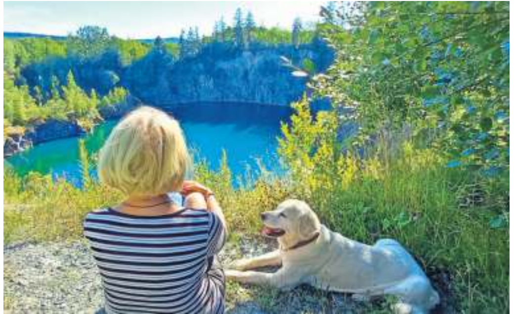
Idylle am Baggersee