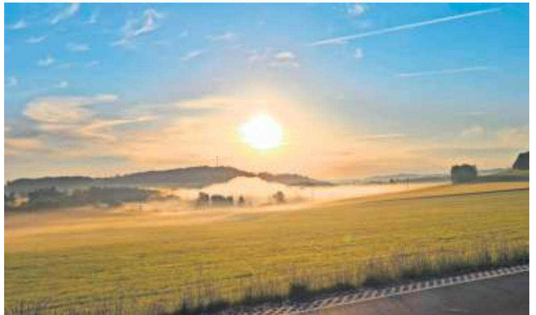
Morgenstimmung im Stebenbachtal von Eva Linsenbühler aus Bad Steben