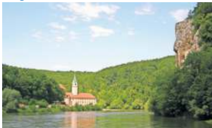
Die VdK-Herbstfahrt geht zum Kloster Weltenburg.

Jeden 2. Dienstag im Monat findet der Stammtisch statt. Der nächste Stammtisch ist am 13. September um 17 Uhr in der Gaststätte „Grüner Baum“. Die Herbstfahrt zum Kloster Weltenburg startet am 24. September . Es ist eine Führung durch das Kloster vorgesehen, wie auch eine Einkehr in der uralten Klosterklostergaststätte. Wenn es die Zeit erlaubt, wird