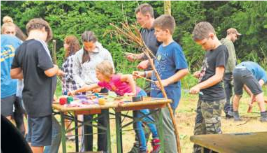
Zeltlagerteilnehmer beim Basteln und Schnitzen am Montag.

Nach einer zweijährigen Coronapause fieberte die katholische Jugend Naila/Selbitz ihrem jährlichen Sommerzeltlager entgegen. In der ersten Ferienwoche war es dann endlich soweit: Vom 31. Juli bis 06. August verbrachten über 50 Kinder und Jugendliche im Alter von 8 bis 16 Jahren und Gruppenleiter verschiedener Konfessionen gemeinsam bei Steinwiesen eine abwechslungsreiche Zeit bei bestem Sommerwetter.