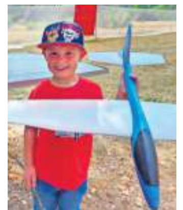
Auch die Jüngsten konnten Flugtechnik ausprobieren.