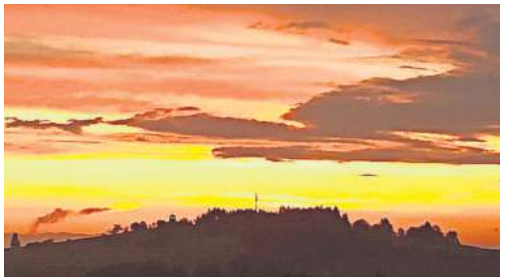
Stimmungsvoller Sonnenuntergang am Langesbühl