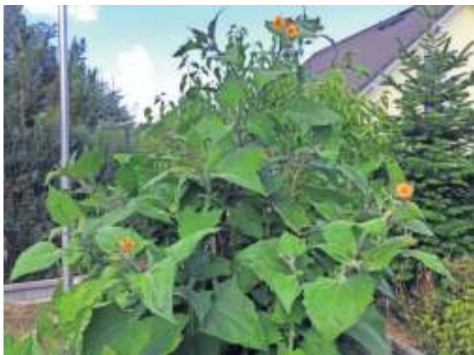
Eine Exotin im Garten, genannt „Inka-Wurzel“, blüht im Garten von Edwin Steffen aus Berg. „Eine Art von Süßkartoffel mit ausladendem Wuchs wenn genügend Platz da ist“, schreibt er