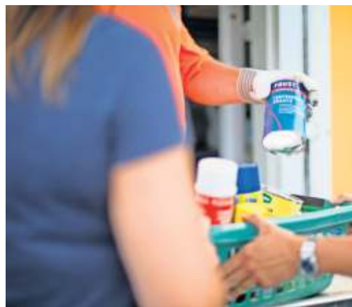
Am Dienstag, 20. September, steht das Problemstoffmobil von 10 bis 12.,30 Uhr und 13.15 bis 17 Uhr am Wertstoffhof Bad Steben.

Für Fragen steht die Abfallberatung des Abfallzweckverbandes unter der Telefonnummer 09281/7259-95 zur Verfügung.