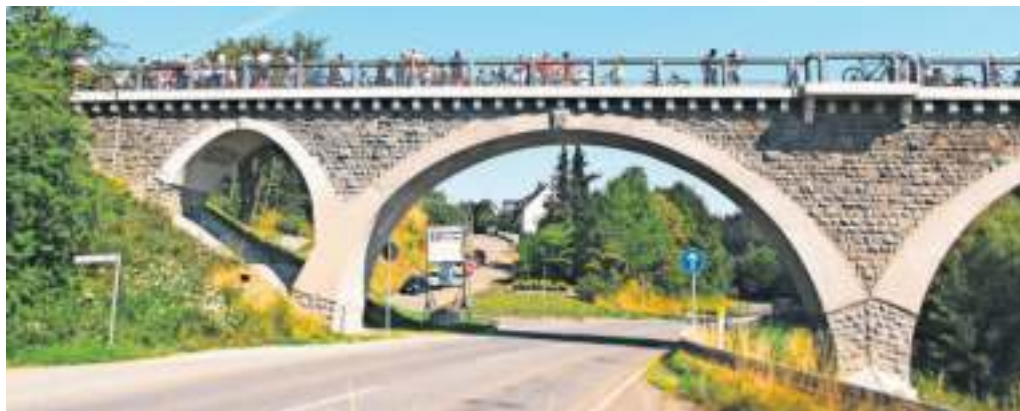
Die Bogenbrücke in Naila ist beim Tag des offenen Denkmals dabei.

Das historische Kesselhaus der Weberei Stoeckel & Grimmler in Münchberg ist ein beeindruckendes Zeugnis der Industriekultur im Hofer Land. In den 1950er Jahren errichtet, blieb die originale Ausstattung – darunter historische Feuerungs-