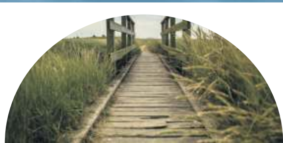
STRASSDORF, IM JANUAR 2023

Eintrittskarten gibt es zum Preis von 15 Euro (ermäßigt 12 Euro) im Vorverkauf in der Bücherstube an der Martinskirche, St. Martin Str. 17, 91301 Forchheim, Telefonnummer 09191 14500 und an der Abendkasse.