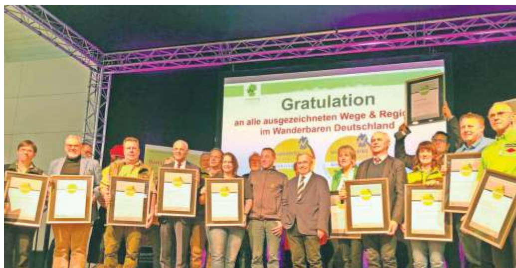
er Frankenwald erhielt erneut das Prädikat zur Qualitätsregion Wanderbares Deutschland.

29.01.), die Internationale Tourismus-Börse (ITB) in Berlin (07.03. - 09.03.) sowie die Frankenbus-Aktionen in „Hessen/Rheinland-Pfalz“ mit den Städten Mainz, Darmstadt, Wiesbaden, 2 x Frankfurt (17.04. – 21.04.), in „Sachsen-Thüringen“ mit den Städten Leipzig, Gera, Jena, Weimar, Erfurt (08.05. – 12.05.) und in „Baden-Württemberg“ mit den Städten Stuttgart, Karlsruhe, Heilbronn, Ulm und Reutlingen (10.07. – 14.07.) auf dem Tourplan.