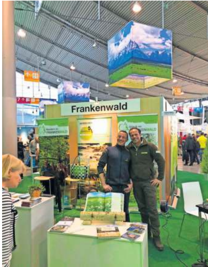
Der Messestand auf der CMT in Stuttgart.