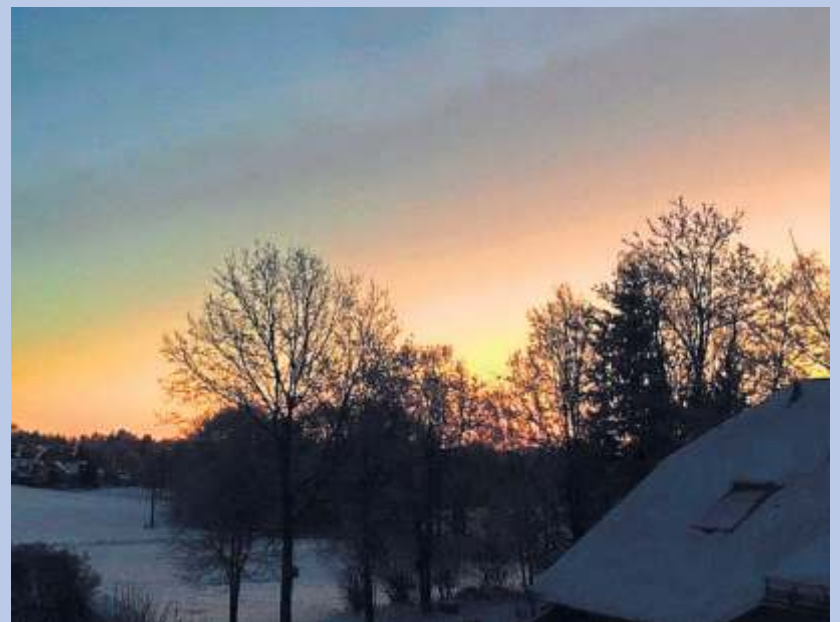
Ein frostiger Wintermorgen