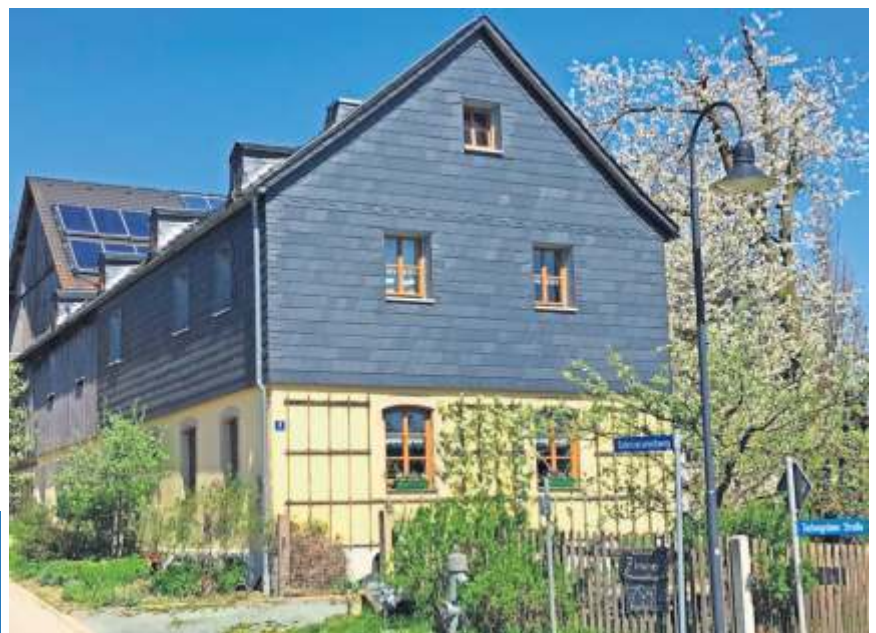
Ein gelungenes Beispiel für eine Sanierung mit Unterstützung aus der Dorferneuerung ist das Wohnstallhaus der Familie Wolfrum in Tiefengrün.

Weitere Informationen dazu erhalten Sie sowohl auf unserer Homepage www.gemeindeberg.de