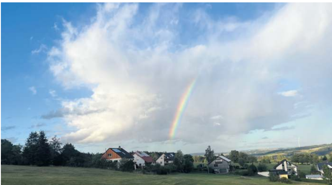
... fotografiert von WIR-Leserin Sylvia Mahall.