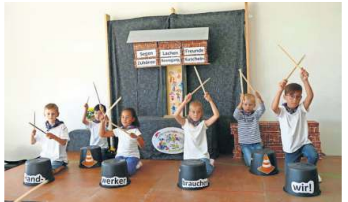
Die Vorschulkinder begeisterten mit verschiedenen musikalischen Einlagen, ob nun dem Luther-Lied, den Trommler-Applaus für die Handwerkskunst oder auch mit dem baulichen Rückblick beim Lied „In Steben wurde ein Haus gebaut“.