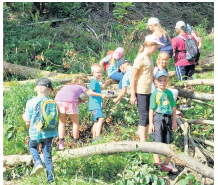
Auf einer Wanderung durch den Wald erkundeten die Kinder die dortigen Naturbegebenheiten.

Eingebunden in die Aktionen des Ferienprogramms der Gemeinde Geroldsgrün hatte sich auch die Ortsgruppe Dürrenwaid des Frankenwaldvereins. Zwanzig Kinder zwischen vier und zwölf Jahre sind dabei der Einladung, die unter der Devise „Ich glaub mein Wildschwein pfeift“ stand, gefolgt. Treffpunkt war das Grundstück von Alt-Bürgermeister Helmut Oelschlegel im Langenbachtal. Hier wurde den Teilnehmern anhand von Präparaten unter anderem die Tiere Fuchs, Dachs, Marder und Eichhörnchen näher erklärt. Diese Geschöpfe wurden von der Kreisjägerschaft Naila dankenswerterweise zur Verfügung gestellt. Gebastelt wurde von den Kindern ein Wildschwein aus Fichtenzapfen und einem Eierkarton. Bei der Zwei-Kilometer-Wanderung auf einem Jägersteig wurde die Natur unter dem Motto „Was hörst du, was fühlst du“ erkundet. Am Ende des rund fünfstün-