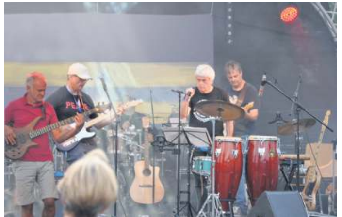
Die Band Nebelschwade.