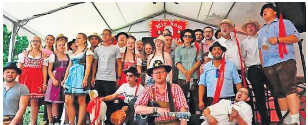
Am Wochenende findet wieder die traditionelle Kärwa in Geroldsgrün statt.

Burgsteinstr., Abzweigung Humboldtstraße (Sammelpunkt), Marktstr., Kreuzung Knockweg (Sammelpunkt), Hirschberglein, Geroldsreuth (Sammelpunkt Sportheim), Goldberg Aus zeitlichen Gründen wurden in diesem Jahr wieder einige Sammelpunkte errichtet, da es sich wegen teilweise mangelnder Anteilnahme nicht lohnt Seitenstraßen anzulaufen. Die Bevölkerung wird um Verständnis gebeten.