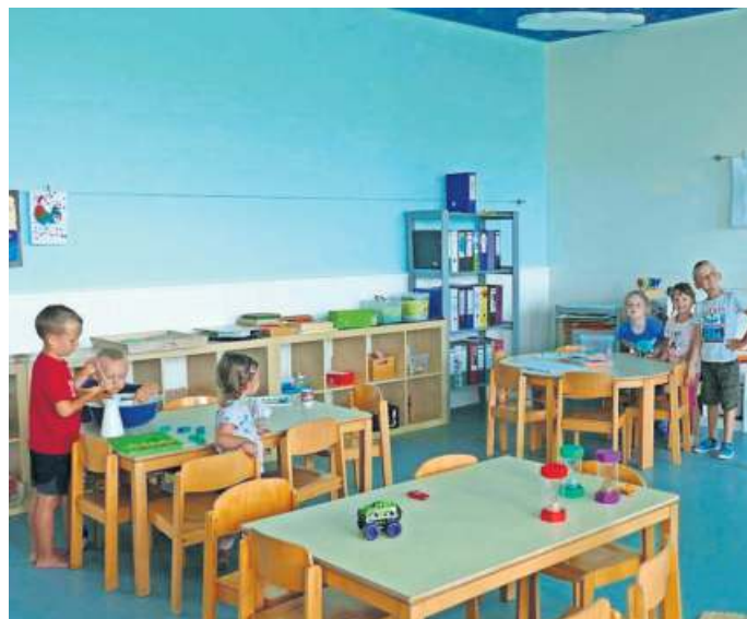
Ein Blick in die Kreativecke im renovierten Igelzimmer.