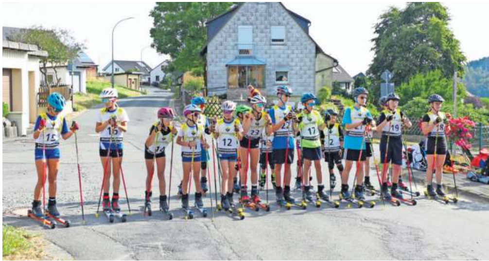
Beim Kids-Run scharrten die hoch motivierten jungen Sportler bereits beim Start mit den „Rollski-Hufen“.