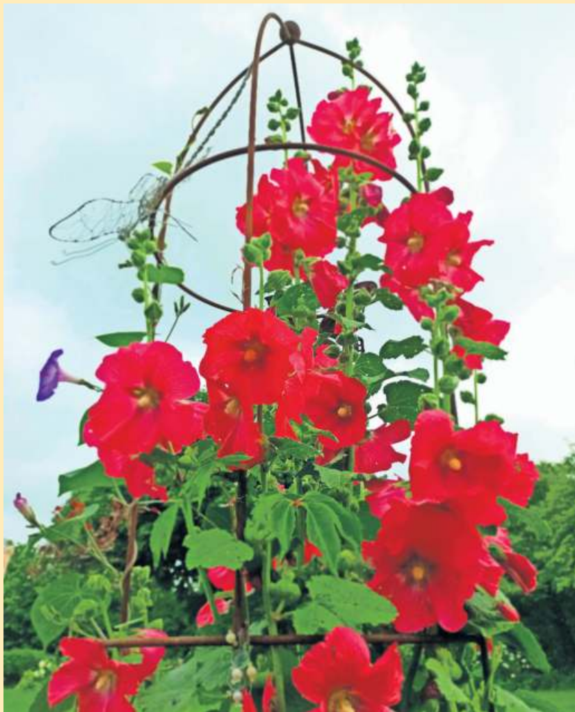
Das Foto einer prächtigen Stockrose aus ihrem Garten in Marxgrün hat Ute Sinterhauf gemailt.