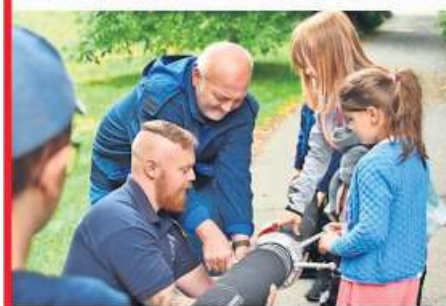
Spannende Aktionen bei der Feuerwehr Döbra