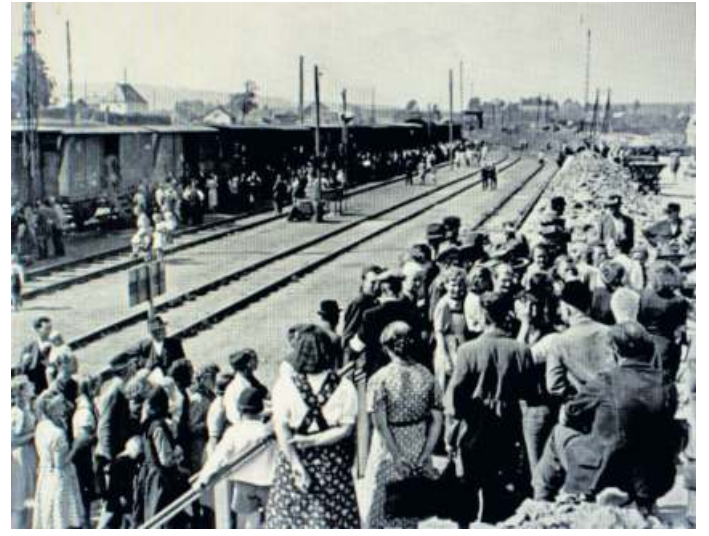
Sudetendeutsche während der wochenlangen Vertreibung 1946 in Güterwaggons.