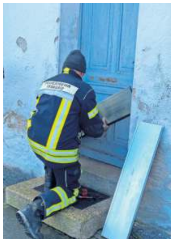
Hier wird ein Schott (mobile Wasserblockade) angebracht.

Landkreis Hof, Stärken und Schwächen des Systems. Landrat Dr. Oliver Bär dankte den Feuerwehren und dem Projektpartner Oneneo GmbH aus Schwarzenbach a.Wald für die enge Zusammenarbeit im Rahmen des Projektes.