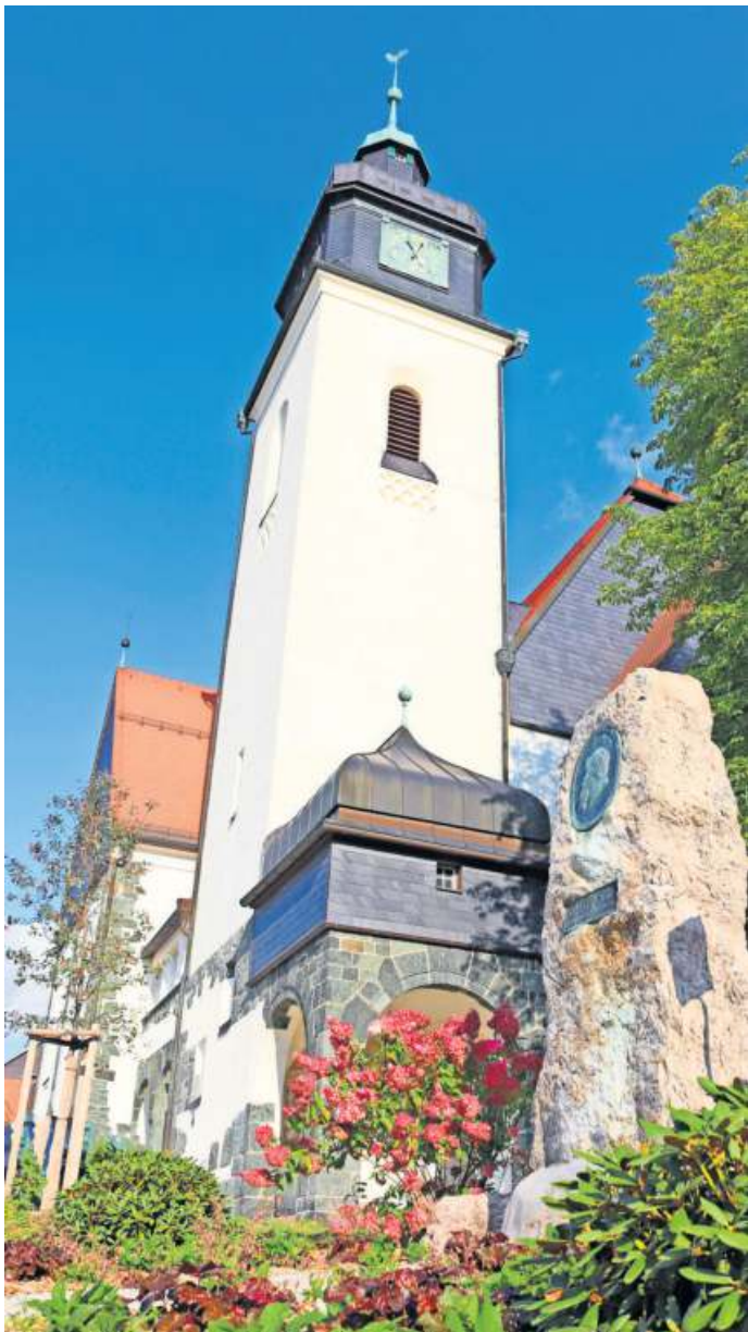
Unter dem Motto „Der Mai ist gekommen“ steht das Konzerterlebnis um 15.00 Uhr in der Lutherkirche.