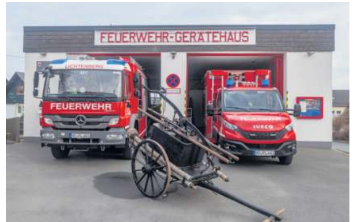
Einsatzfahrzeuge der Freiwilligen Feuerwehr Lichtenberg vor dem Feuerwehrgerätehaus; im Vordergrund die handbetriebene Saug- und Druckspritze aus dem Gründungsjahr 1874

Die Geschichte der Freiwilligen Feuerwehr Lichtenberg geht zurück auf das Jahr 1874. Am 10. März wurde neben der dazumal bereits seit längerem bestehenden Pflichtfeuerwehr in der Stadt Lichtenberg eine Freiwillige Feuerwehr gegründet. Der damalige Stadtmagistrat Jungkunz erließ am gleichen Tag die notwendigen Statuten und Dienstvorschriften hierfür. Geführt wurde die Feuerwehr anfangs durch Stadtschreiber Dietel als Vorsitzenden sowie Schreinermeister Friedrich Röde als Hauptmann. Die ordentlichen, uniformierten Mitglieder (heutige aktive Wehr) wurden damals aufgeteilt in Steiger, Spritzenmänner und Retter. Im Feuerwehrgerätehaus am Marktplatz (jetzt Marktplatz 39) waren an Gerätschaften eine Handdruckspritze, Leitern und Wassereimer vorhanden. Die handbetriebene Saug- und Druckspritze ist noch heute im