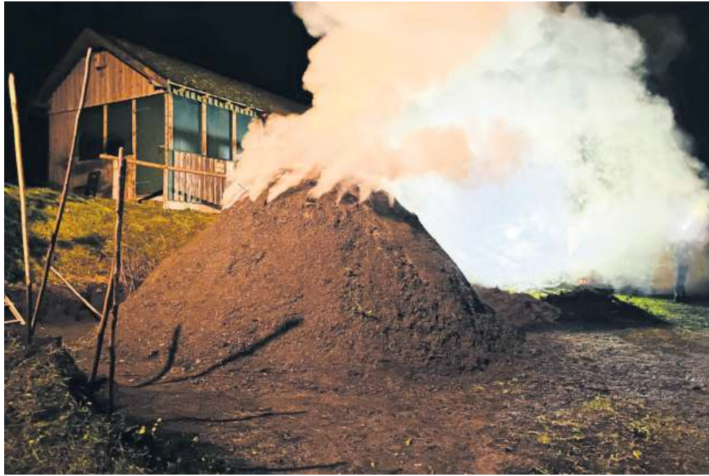
Der schwelende Kohlenmeiler

Um einen Kohlenmeiler zu errichten, muss zunächst Buchenholz aufgeschichtet werden, dann mit einer Schicht Fichtenstreu und abschließend mit der sogenannten „Lösch“ – einer Mischung aus den Resten der vorangegangenen Meiler, toniger Erde und Sand – abgedeckt werden. Der Aufbau des Meilers dauert mehrere Tage, alle Arbeiten werden rein ehrenamtlich von den Köhlerfreunden durchgeführt. Umso mehr freuen sie sich dann auf