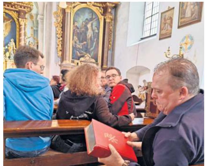
In der Klosterkirche wurden die Protestanten vom Sparclub in kirchliche Zeremonien der Katholiken eingeweiht.