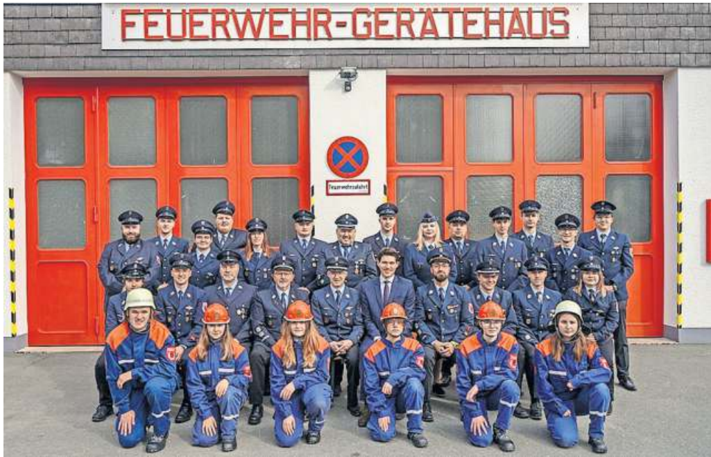
Aktive Mannschaft im Jubiläumsjahr 2024