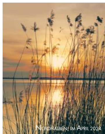
NORDHALBEN! IM APRIL 2024

Familie Schindler sowie alle Angehörigen